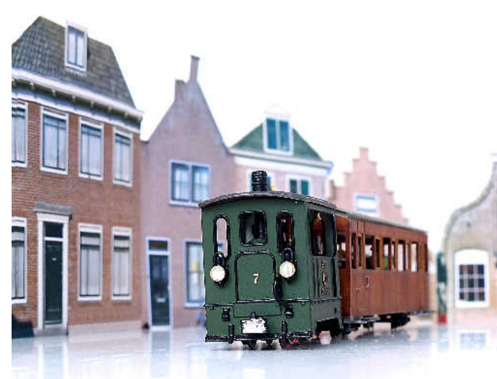
Tram '7', genaamd 'De Rijk'.