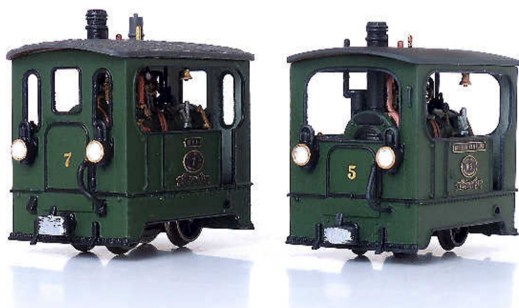
Miniatuurversies van trams '5' en '7'.

Verf, messing en lood maken de locomotieven af