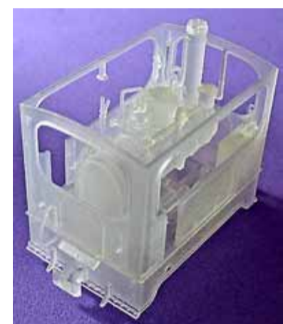
Kale 3D-print van een locomotief.