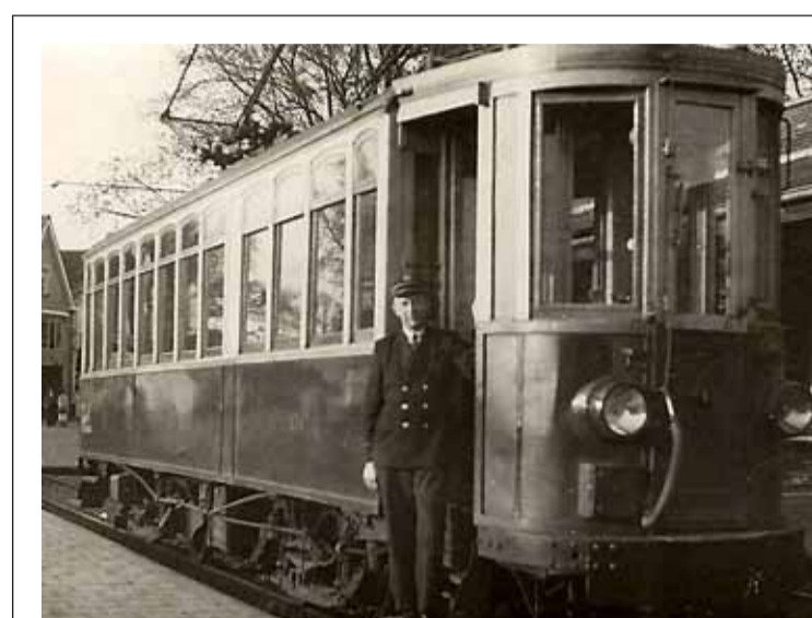
Trambestuurder Beets in Purmerend, jaren vijftig.