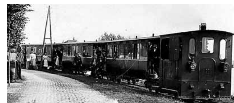
Een tram op station 't Schouw aan het begin van de twintigste eeuw. ARCHIEFFOTO

De website Blauwetrans.nl beschrijft de geschiedenis van de tram zoals die tussen 1881 en 1961 reed tussen Scheveningen, Den Haag, Leiden, Katwijk, Noordwijk, Haarlem, Zandvoort, Amsterdam, Purmerend, Edam en Volendam. Ook op de site van modelbouwer Sven van der Hart – Tramfabriek.nl – staat veel informatie over de historie van de Waterlandse trams.